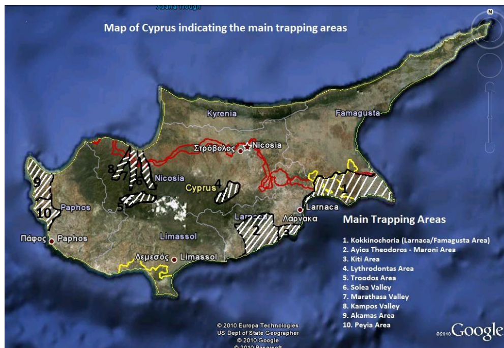
Figure 1 Map of Cyprus showing the main trapping areas

Although trapping is also an issue in other areas of Cyprus, the survey efforts focus on these two main areas due to resource limitations and because they hold the highest trapping activity.