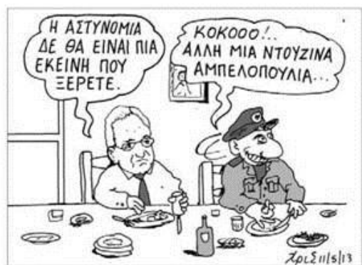
Figure 7 Haravgi newspaper cartoon graphic on 14/5/2013 showing the Minister of Justice saying 'The Police will no longer be as it was!' and the policeman shouting out 'Koko, fetch another dozen ambelopoulia...'.