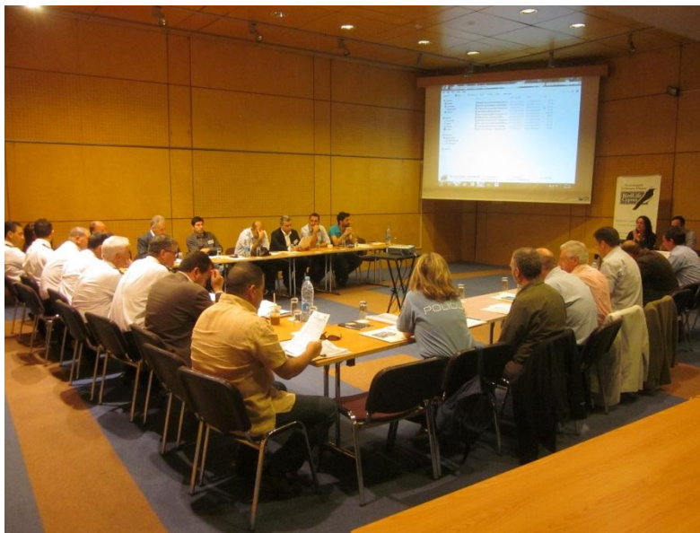
Figure 4 Participants at the StAP workshop

Short, medium and long-term actions were identified for all of the above areas, along with key stakeholders and targets for each of the identified elements.