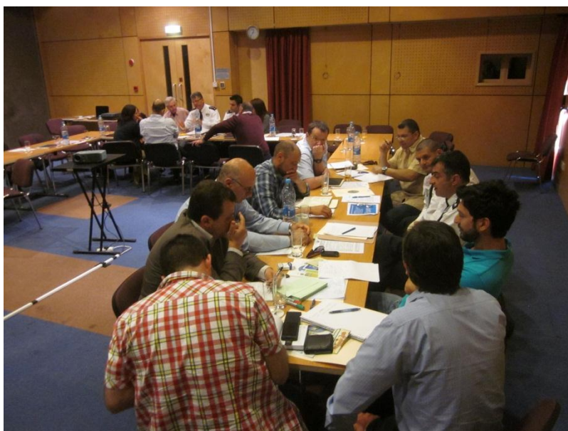
Figure 5 Working group discussions for the development of an action plan

During May 2013, the workshop and the efforts to develop a StAP on illegal bird trapping in Cyprus were presented at the 2nd Bern Convention Conference on illegal bird killing, trapping and trade of wild birds, which took place on the 29-30th May 2013 at Tunis (Tunisia). This conference was the follow up from the Larnaca Conference (July 2011) where a 'zero tolerance' approach was pledged by all participants. The Tunis Conference focused on drawing up an action plan at a Convention level in order to engage all the signing parties to develop National Communication strategies for ending illegal bird killing, in a similar structure as the workshop in Cyprus. So the work at Cyprus level for developing a StAP is also very relevant and can help towards meeting the requirements of the Bern Convention action plan that is being developed.