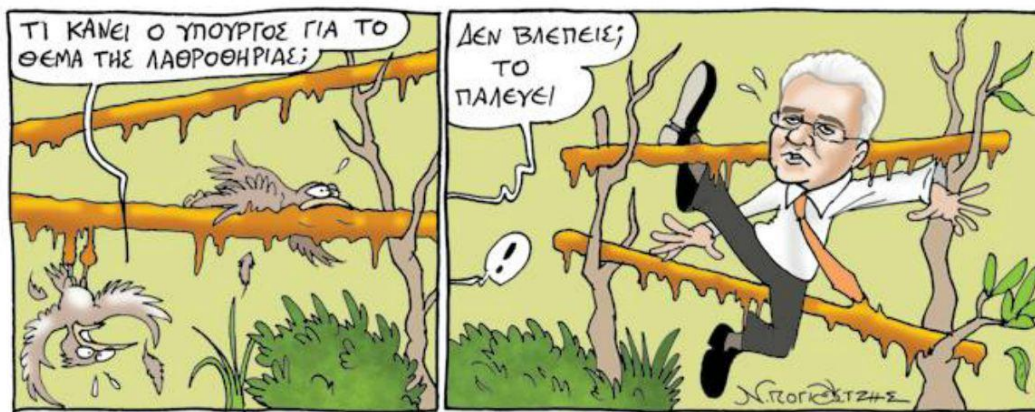
Figure 6 Fileleftheros newspaper cartoon graphic on 3/5/2013, with the bird asking: 'What is the Minister doing on the poaching issue?' and the response 'Can't you see? He's struggling with it!'.

The incident received a lot of media attention, the majority of it being critical or sarcastic of the political decision that was taken (see figures below).